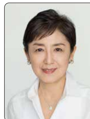
KUNIYA Hiroko (国谷 裕子)