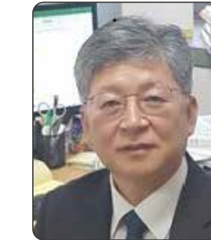
KANG Sung Jin

COP26 気候行動ハイレベルチャンピオン High Level Climate Action Champion, COP26